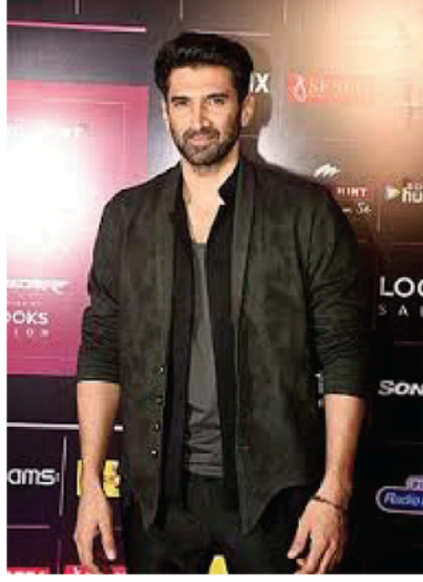
श्री आदित्य रॉय कपूर