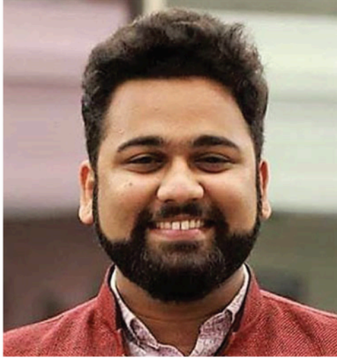
सी.एस. अँड. कुणाल सर्पल